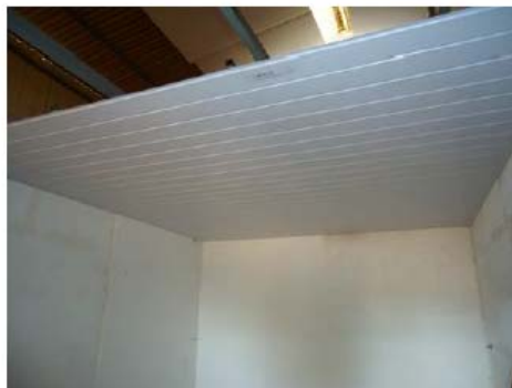
Amostra LAB 631 instalada – forro constituído de perfis de PVC modelo 200x8mm duplo

Este relatório de ensaio refere-se somente às amostras ensaiadas e encaminhadas ao laboratório. Este relatório de ensaio só pode ser reproduzido completo.