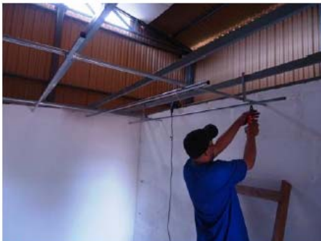
Montagem da estrutura de sustentação dos perfis de PVC para forros, composta por perfis e pendurais metálicos

As fotografias abaixo ilustram a sequência da instalação e preparo da amostra para o ensaio.