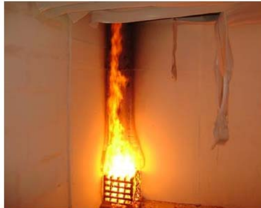
Ensaio em andamento onde se verifica o desprendimento dos perfis de PVC da sua estrutura de sustentação. O material não sofreu ignição, não propagou chama e não gerou fumaça