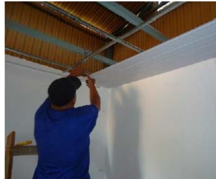
Colocação dos perfis de PVC para forro