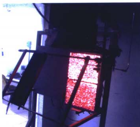
Figura 1: Equipamento de ensaio

Os corpos de prova, com dimensões de 150 \pm 5 mm de largura e 460 \pm 5 mm de comprimento, são inseridos em um suporte metálico e colocados em frente a um painel radiante poroso, com 300 mm de largura e 460 mm de comprimento, alimentado por gás propano e ar. O conjunto (suporte e corpo de prova) é posicionado em frente ao painel radiante com uma inclinação de 60^\circ , de modo a expor o corpo de prova a um fluxo radiante padronizado. Uma chama piloto é aplicada na extremidade superior do corpo de prova.