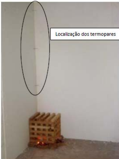
Início do foco de incêndio

As fotografias a seguir mostram as ocorrências durante o ensaio: