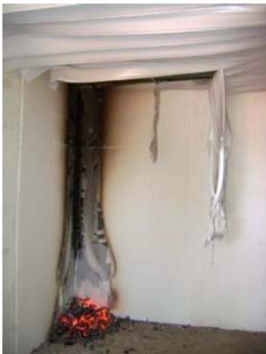
Final do ensaio